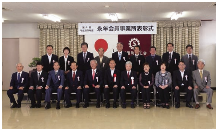
授賞式に出席されたみなさん