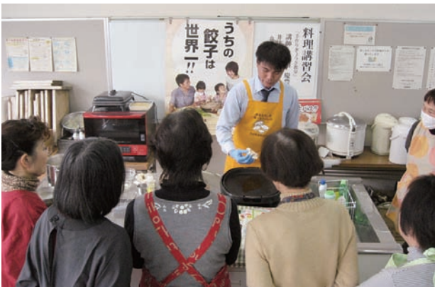
手作りぎょうざ教室

部員十三名の参加者に、餃子の包み方や焼き方のコツなど丁寧にご説明いただき、他にも餃子と卵のスープ・ご飯・デザート2種を作りました。参加者は普段よりおいしく餃子を作ることができたと、満足していました。