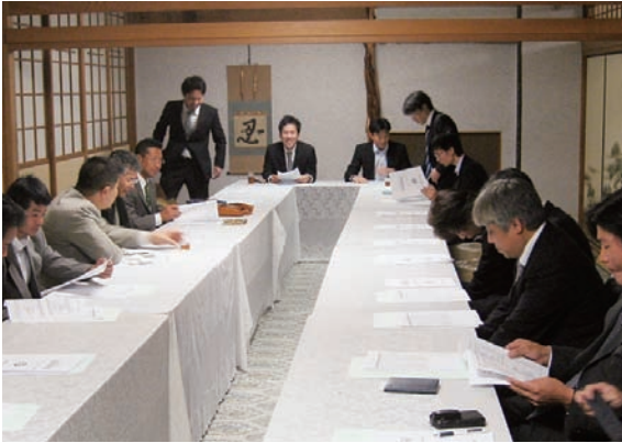
総会の様子。いつもと違う緊張感が漂うなかで慎重審議。