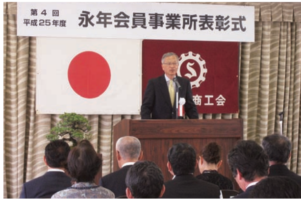
高田副会長による開式の辞

総代会終了後、引き続き永年にわたり商工会会員として、ご加入いただいている事業所(四十二名)の方を表彰させていただきました。