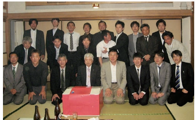
懇親会終了後の集合写真。真っ赤な四角い箱は、定年部員へのプレゼント。